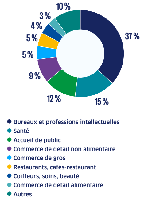
RÉPARTITION DES ÉTABLISSEMENTS DE MOINS DE 20 SALARIÉS PAR SECTEUR D'ACTIVITÉ

Les principaux secteurs d'activité représentés chez les professionnels sont pour plus d'un tiers les professions intellectuelles , et pour environ 10 % chacun la santé et l'accueil du public .